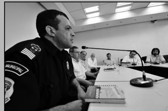
Reunião realizada no dia 23

Mapear os equipamentos públicos que poderiam ser ocupados por grafiteiros, como forma de evitar pichações. A alternativa será apresentada pela Comissão de Saúde e Meio Ambiente (Cosmam) da Câmara Municipal a órgãos da prefeitura. A ideia foi discutida em reunião da comissão realizada na manhã de terça-feira (22/3). O presidente da Cosmam ressaltou a diferenciação entre pichação e grafite (painéis temáticos contemporâneos feitos por jovens que usam técnicas de manifestação caricata).