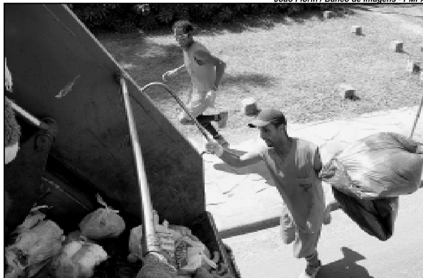
Caminhões de coleta deverão ter equipamentos para minimizar a emissão de ruídos

O edital estará disponível para aquisição na sede da Secretaria Municipal da Fazenda (Siqueira Campos, 1300 – 11º andar, sala 1106) ou acessível gratuitamente para solicitações encaminhadas ao e-mail acseditais@smf.prefpoa.com.br , mediante informação do CPF ou do CNPJ do interessado. As propostas serão recebidas até o dia 1º de março, às 9h45, quando será realizada a abertura dos envelopes de habilitação.