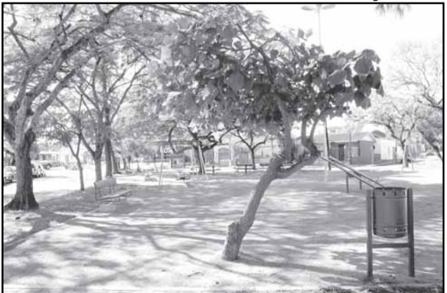
Major Augusto Koch é uma das sete praças revitalizadas em 2009