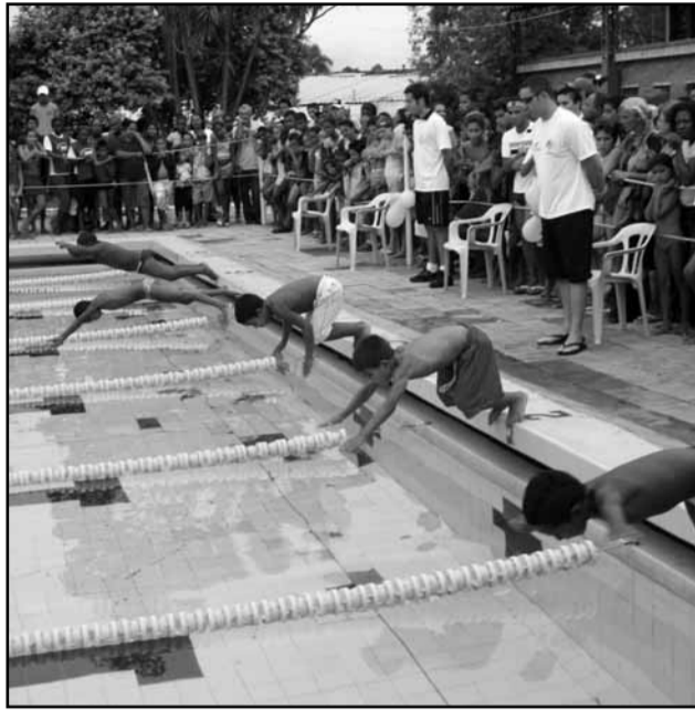
Competidores foram selecionados durante a temporada