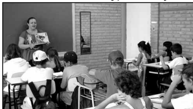
Alunos retornam dia 4 de março nas 94 escolas municipais

Novo prazo de matrículas — Quem não conseguiu vaga na rede municipal de ensino nas primeiras etapas do processo de matrícula terá mais uma chance a partir do dia 2 de março.