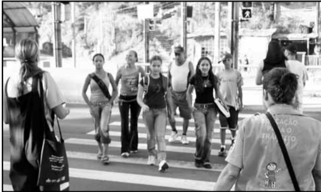
Campanha vai promover a travessia segura de pedestres