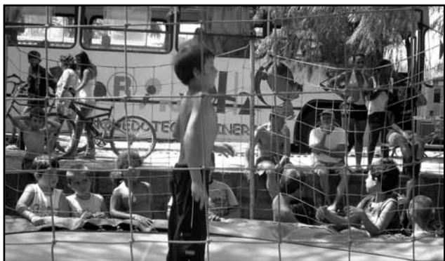
O Brincalhão será uma opção para as crianças da comunidade