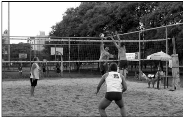
Jogos acontecem no Marinha do Brasil

adaptado com brinquedos, jogos e outros equipamentos e funciona como uma brinquedoteca ambulante, será uma opção para as crianças da comunidade. Nos meses de janeiro e fevereiro, a SME realiza no Lami atividades recreativas e esportivas gratuitas, das 13h às 19h, com o objetivo de diversificar as opções de lazer de crianças, adolescentes e adultos durante o Verão.