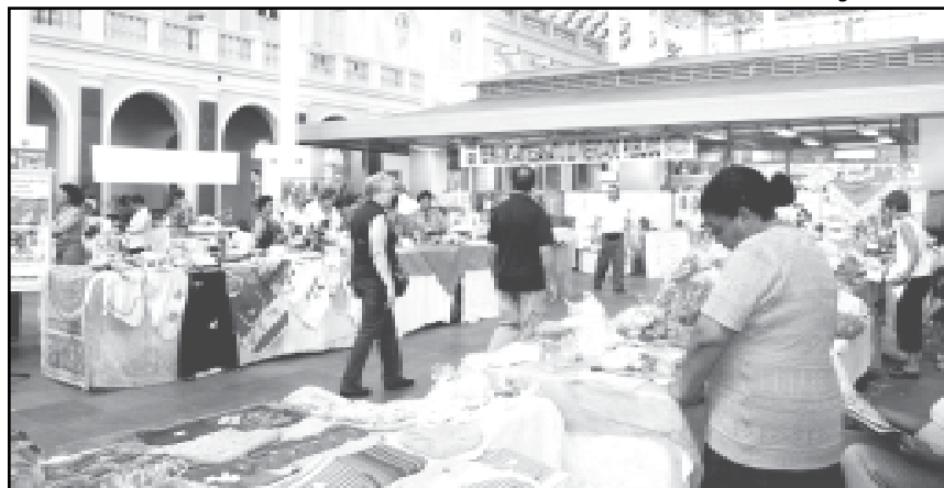
São 53 bancas com diferentes tipos de artesanato