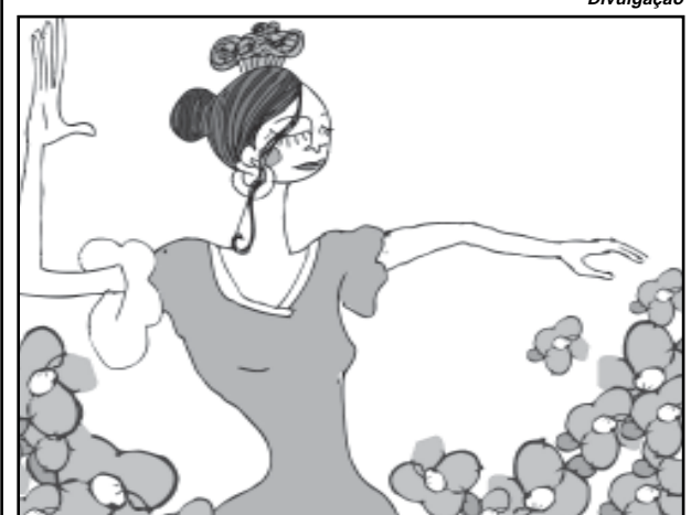
Flamenco é o tema da amostra

A mostra pode ser visitada das 9 às 18 horas, de segundas a quintas-feiras, e das 9 às 16 horas, às sextas-feiras (até 15 horas no último dia). Informações na Assessoria de Relações Institucionais da Câmara (Avenida Loureiro da Silva, 255), telefone (51) 3220-4392, ou com o artista: e-mail claudioelias@claudioelias.com.br e fones (51) 3212-4892 e (51) 8141-5411.