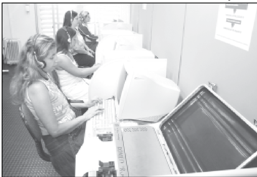
Em 2007, foram capacitadas 1170 pessoas. Entre janeiro e abril de 2008, outras 305 pessoas receberam capacitação, incluindo idosos e deficientes visuais

Virtual Vision — Das vagas disponibilizadas mensalmente para os cursos, uma parte é destinada à capacitação digital de pessoas idosas e portadores de deficiência visual. Dos 13 computadores usados nos cursos, cinco são equipados com o software Virtual Vision, que faz a leitura da tela para os portadores de deficiência visual. Em 2007, foram capacitadas 1170 pessoas. Entre janeiro e abril de 2008, outras 305 pessoas receberam capacitação, incluindo idosos e deficientes visuais.