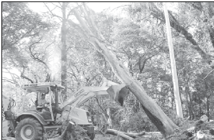
Trabalho é demorado e utiliza, trator, caminhão guincho e retroescavadeira