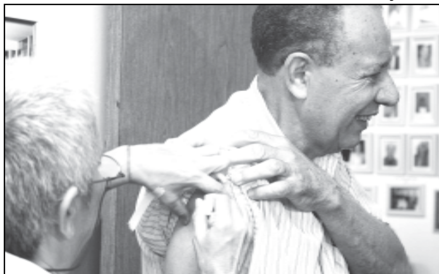
Campanha vai até o dia 23 e pretende vacinar mais de 138 mil idosos

O vírus provoca infecções no sistema respiratório. É uma gripe contagiosa, podendo apresentar desde uma maneira mais leve e de curta duração até formas clinicamente graves e complicadas. O influenza se dissemina rapidamente, sendo responsável por elevado índice de doenças e até morte em grupos de maior vulnerabilidade.