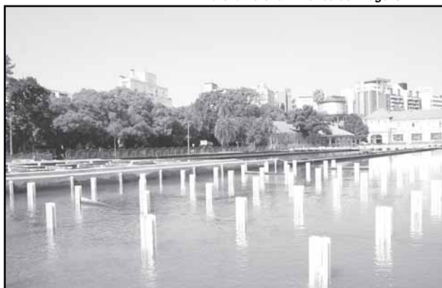
O encontro vai tratar sobre projetos, equipamentos e aplicações práticas de reaproveitamento de água