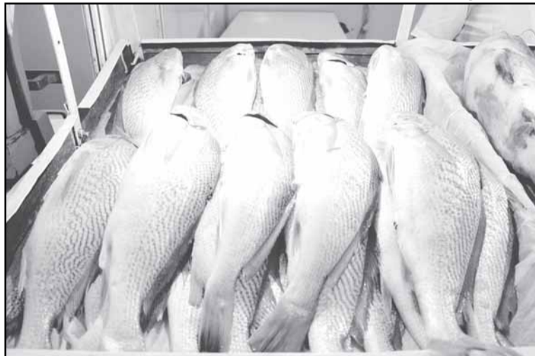
O peixe, que compõe a lista de alimentos, virá da Colônia Z5