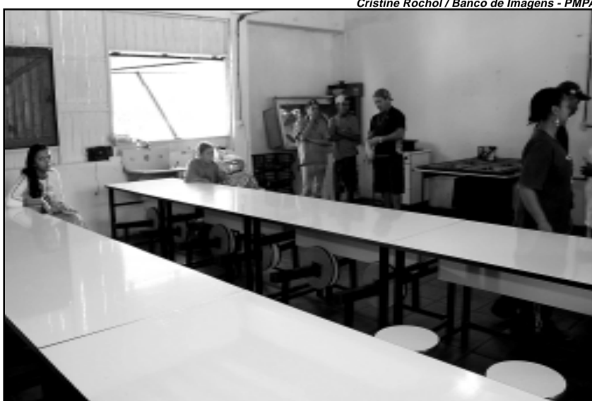
Cozinha comunitária da Associação Aparecida das Águas

Nas comunidades, o prefeito conversou com os catadores e reafirmou o compromisso da Prefeitura em melhorar o sistema de trabalho, estabelecer parcerias e criar condições para a organização das unidades. “O sistema cooperativo é o mais adequado para a triagem. A Prefeitura está firmando parcerias, através da Governança Solidária, para valorizar os trabalhadores e fazer com que todos se beneficiem”, afirmou o prefeito. Em maio, a Prefeitura assinou termo de cooperação junto às unidades de triagem de resíduos recicláveis garantindo o repasse mensal de R$ 2,5 mil para cada associação de catadores da Capital.