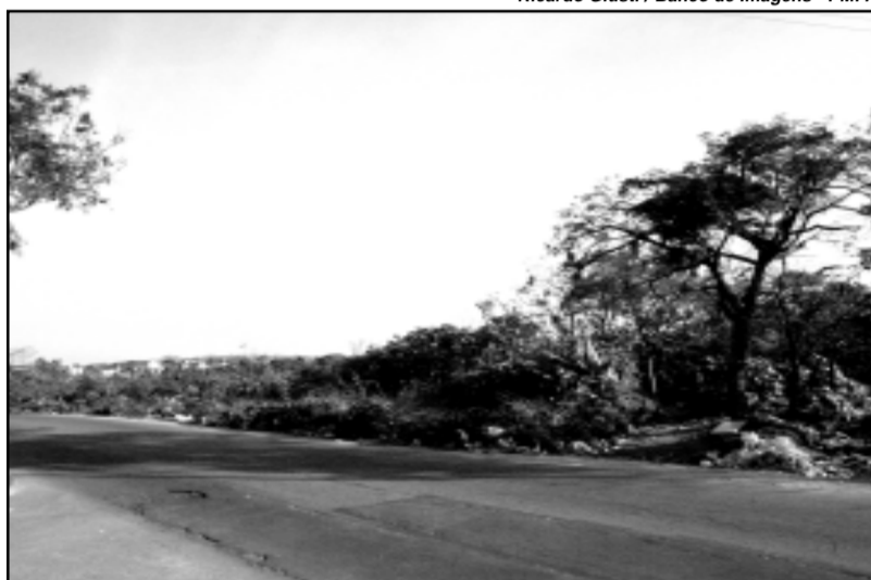
Prefeitura recebeu a posse da área no último dia 14

No último dia 14, o Demhab recebeu documento de emissão de posse, concedido pela 2ª Vara da Fazenda Pública, determinando a expedição de mandato em favor do município. Com isso, o terreno do Porto Seco, que receberá a comunidade da Vila Dique, passou a ser propriedade do Executivo municipal. A medida foi possível devido a uma ação da Procuradoria-Geral do Município. Além das oito secretarias municipais, também estão empenhados na transferência da Vila Dique o Governo do Estado e a União.