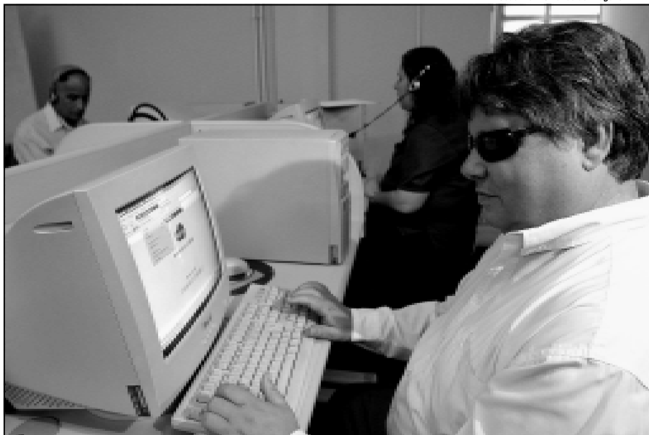
Formatura da primeira turma de alunos com deficiência visual será neste semestre