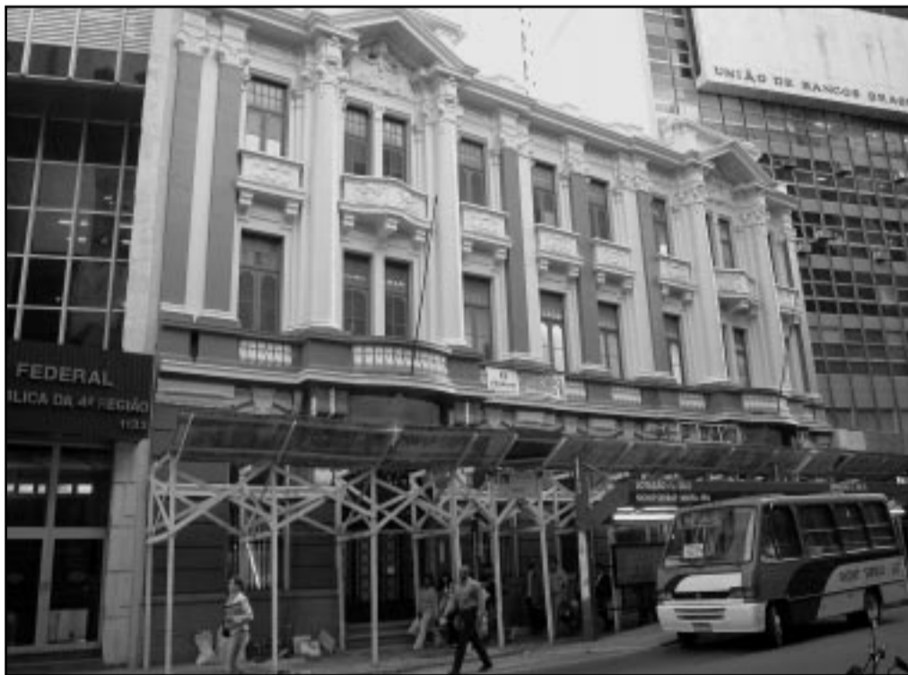
Prédio, que recebe acabamentos, proporcionará mais conforto ao usuário