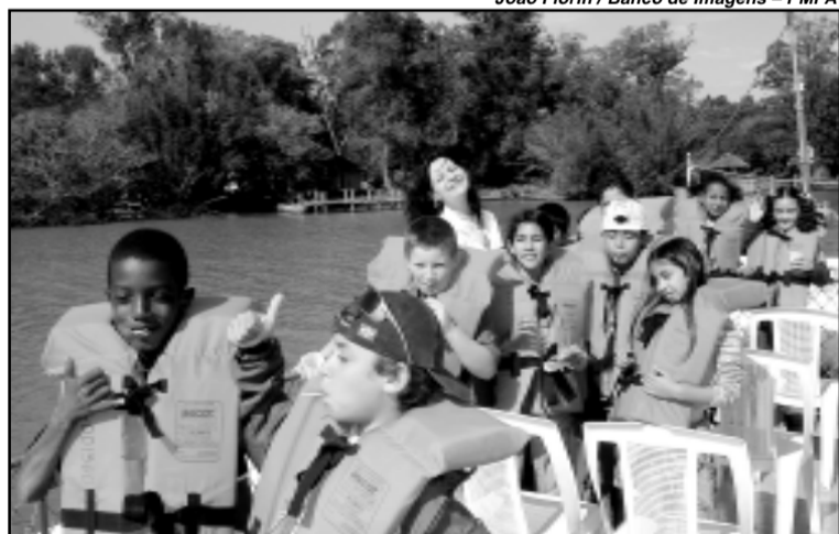
Alunos da Escola Afonso Guerreiro Lima fizeram o passeio ontem