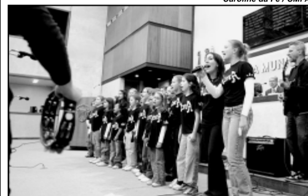
Alunos cantaram no plenário