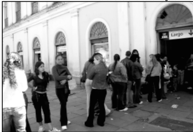
Processo seletivo termina amanhã

A prática de esporte e atividades recreativas marcaram a programação da Semana do Idoso ontem à tarde, com a participação de cerca de 500 idosos, que puderam optar entre diversas atividades. Houve oficinas de dan-