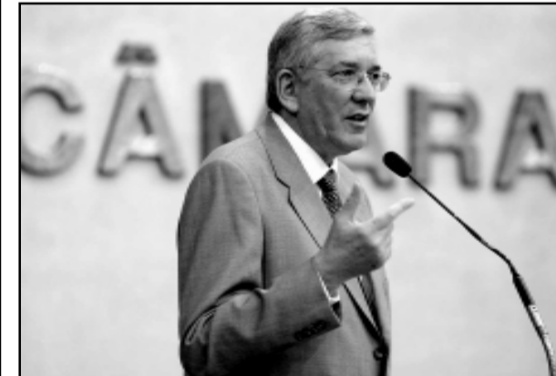
Cidadão atua no setor calçadista