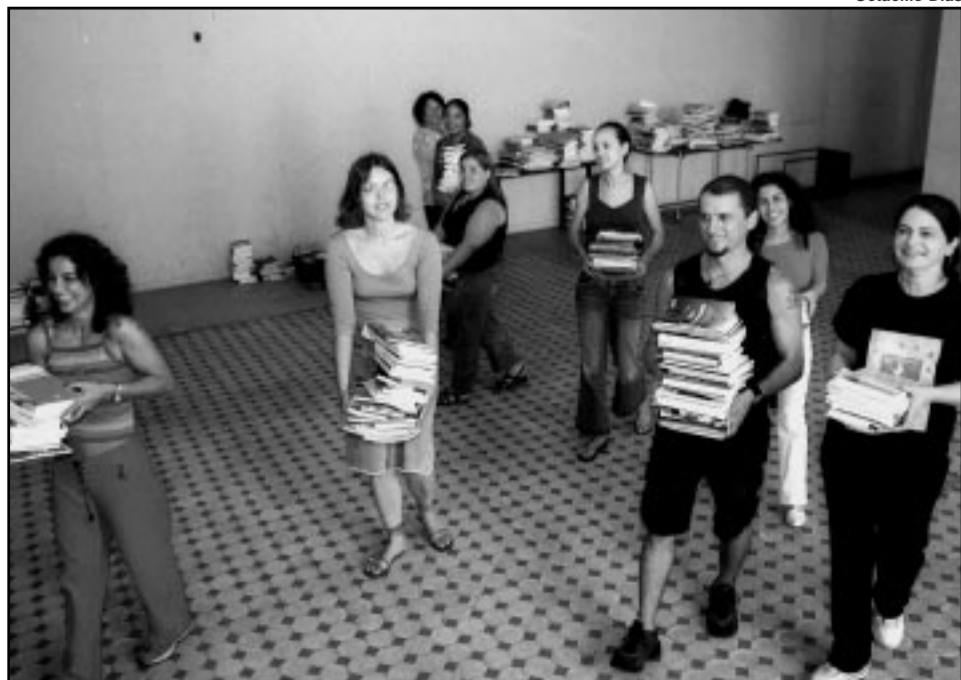
Biblioteca instalada na Usina do Gasômetro amplia acervo com doações