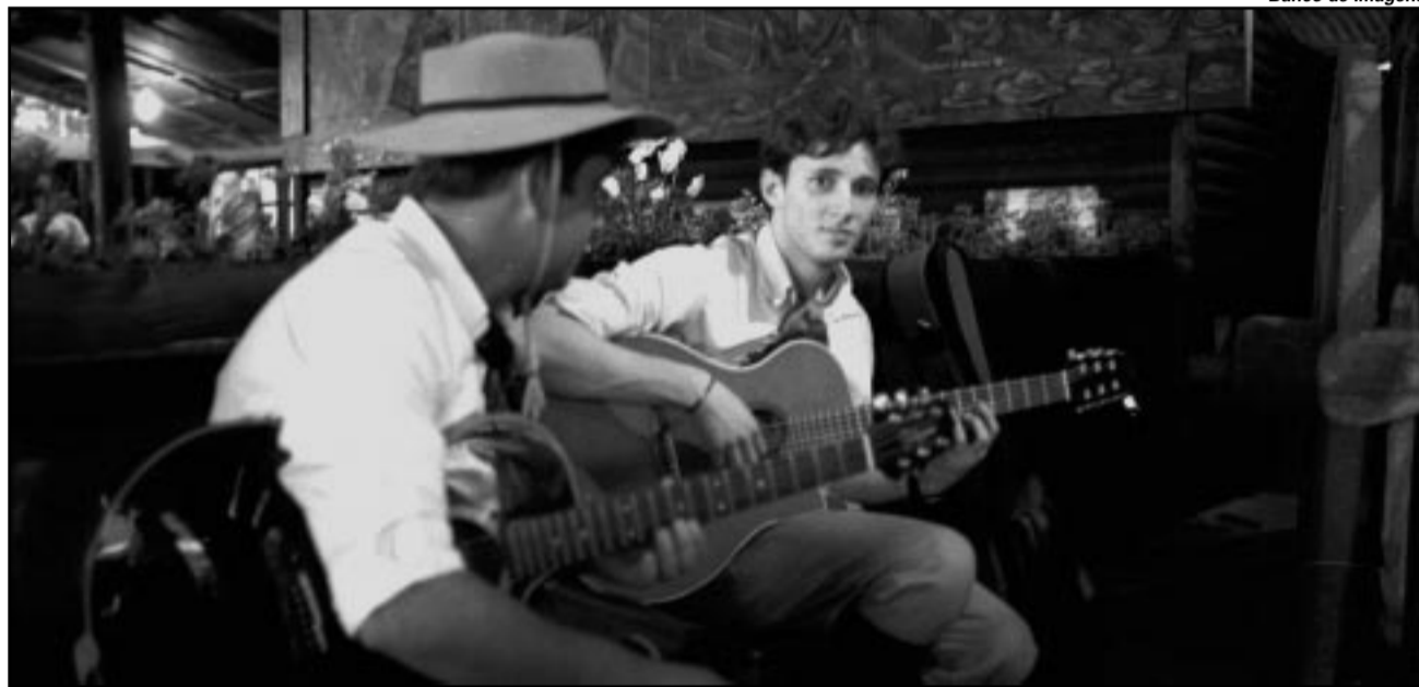
Músicas com ritmos da chamada Gran Patria Gaúcha serão aceitas no concurs