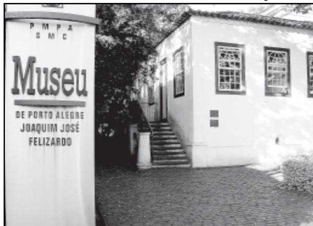
Projeto arquitetônico original foi reconstituído