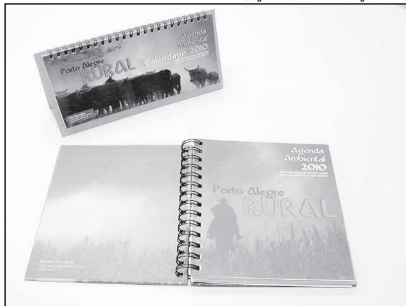
As fotos participaram do concurso Porto Alegre Rural