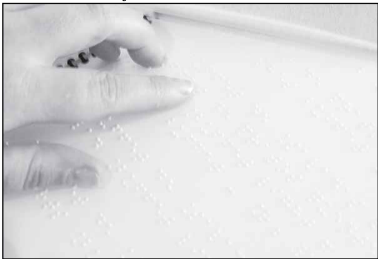
Professores ficarão aptos a trabalhar com músicos e estudantes cegos