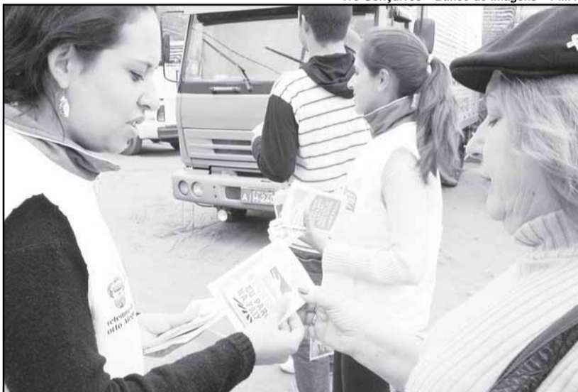
Monitores mantêm agenda semanal

Além da propaganda da campanha na mídia, prosseguem as ações educativas em pontos diversos da cidade, com a distribuição de folders e adesivos. A equipe de agentes da Assessoria de Educação para o Trânsito (Asset) da EPTC continua com ações junto às escolas. A atividade de