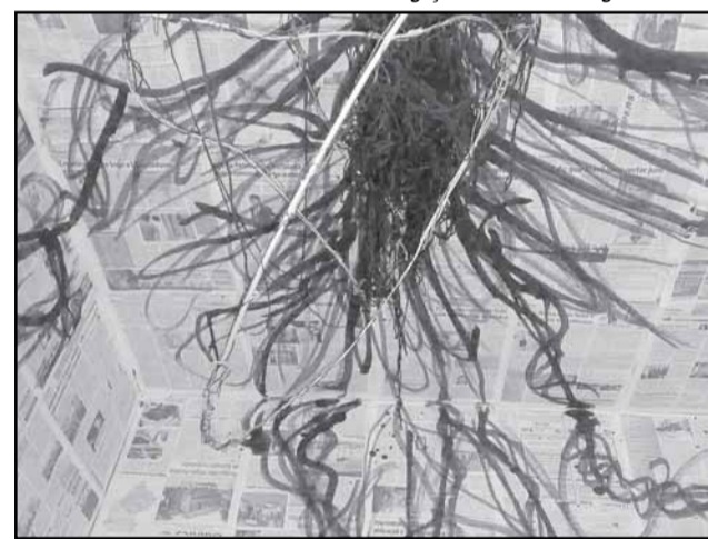
O exercício de liberdade ocupa os corredores e passagens do ex-reservatório de água