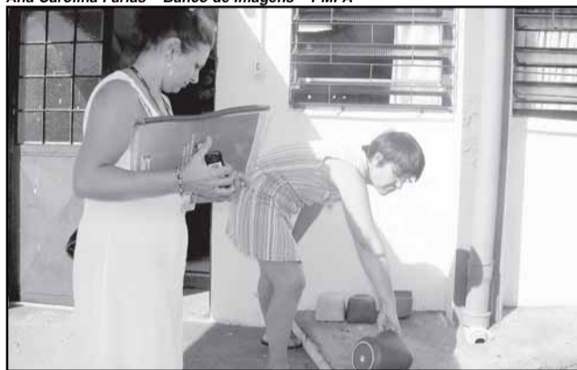
Boas práticas devem ser constantes para evitar propagação da doença