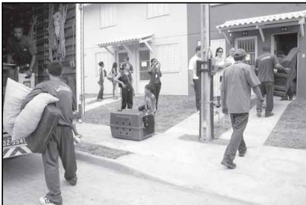
A transferência começou em outubro, sendo que já foram reassentadas 84 famílias