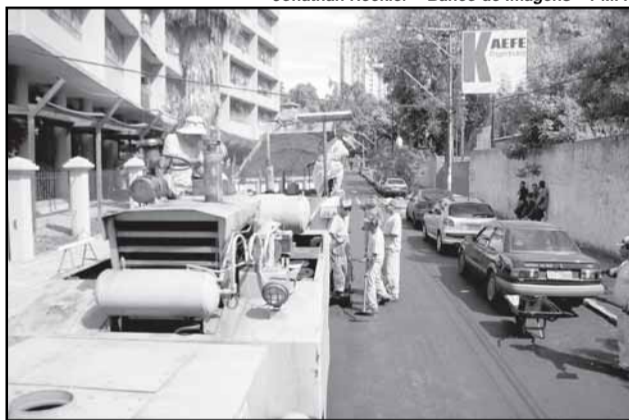
A segunda etapa recuperou 34,6 quilômetros de vias em locais de grande circulação