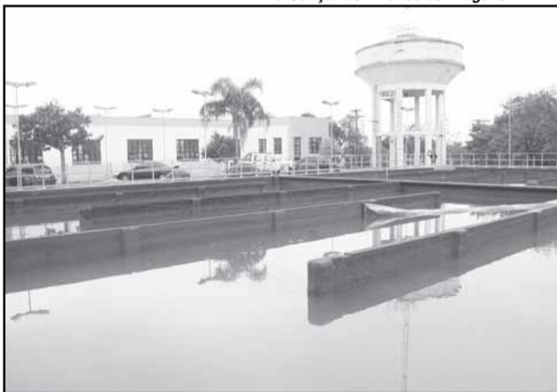
Neste ano, o tema da campanha é “Água limpa para um mundo saudável”

ços em 2030, com o tratamento de esgotos chegando a 83% em 2015. Em 2006, Porto Alegre também havia sido mencionada em publicação da ONU como um exemplo notável na distribuição de água a preços acessíveis, sendo o Dmae citado por melhorar de forma drástica as receitas e reduzir as perdas de água.