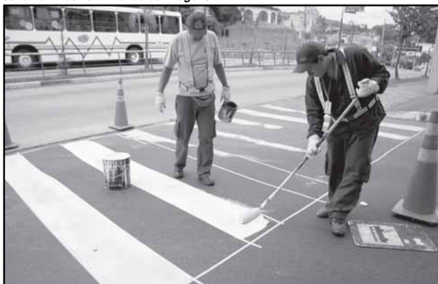
Repintura das faixas tem programação diária que prioriza áreas de escolas