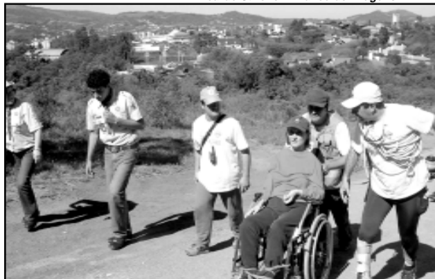
Programação prevê um roteiro exclusivo para PPDs