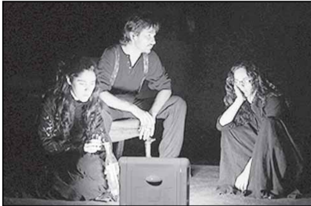
Grupo Teatro en el Blanco apresenta espetáculo com temática política e social