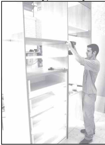
O Pólo Moveleiro comercializa móveis sob medida