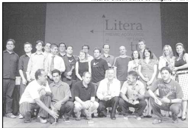
Vencedores da última edição do prêmio