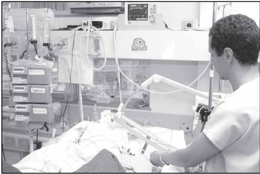
Unidade conta com modernos equipamentos para politraumatizados