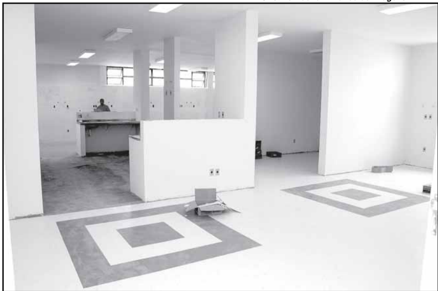
Obras foram concluídas em abril