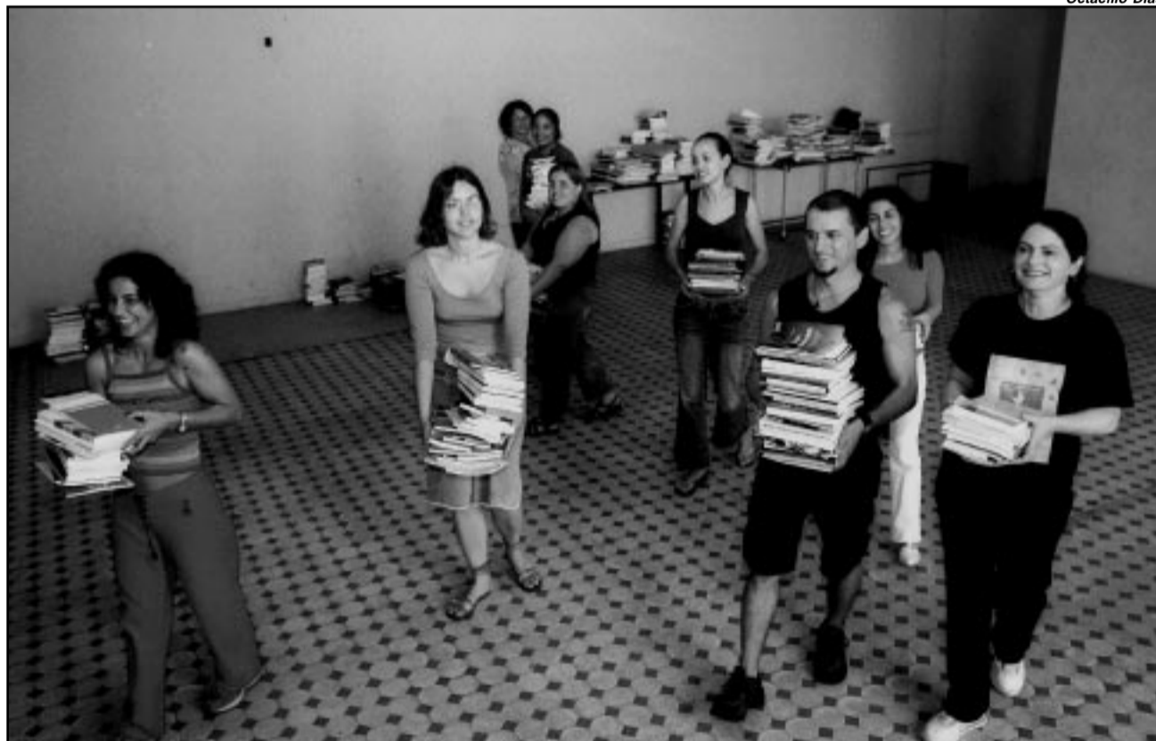
Sala 309 da Usina do Gasômetro abriga as publicações desde dezembro