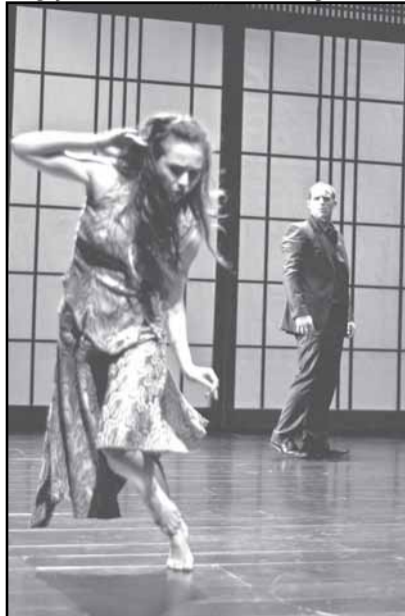
Montagem no Bourbon Country é uma paródia ao filme de Tarantino