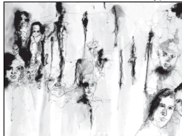
Desenhos mostram cotidiano