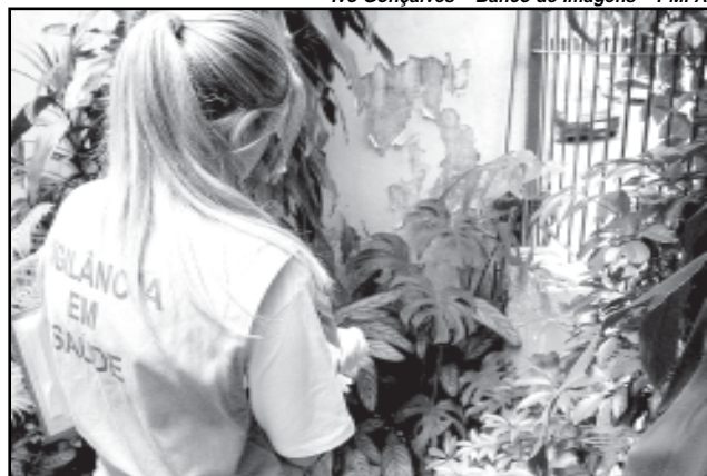
Agentes de fiscalização vistoriaram mais de 25 mil imóveis em 81 bairros