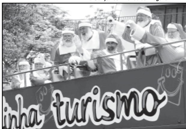
Doação de brinquedos dá direito a desconto nos ingressos do city tour

A Secretaria Municipal de Turismo (SMTUR) e a Companhia Carris Porto-alegrense lançaram ontem a campanha