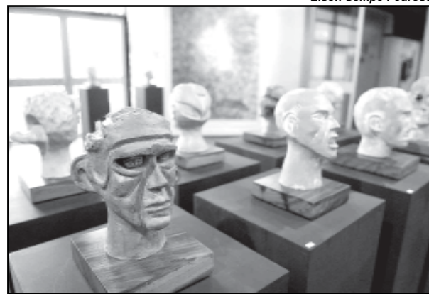
Trabalhos usam argila, cimento e bronze