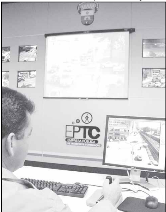
As imagens permitem um diagnóstico online das condições de circulação