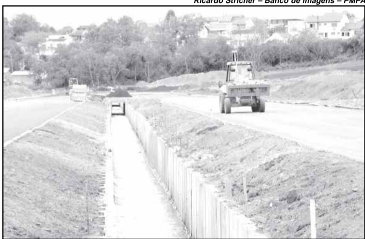
Mais de 70% das obras de infra-estrutura da nova Vila Dique estão concluídas

Será instalado um galpão de triagem, com mil metros quadrados, para materiais recicláveis. A reciclagem de materiais é fonte de renda e trabalho para cerca de metade dos moradores das vilas. Todas as vias serão asfaltadas. As casas terão 42 metros quadrados e dois dormitórios.