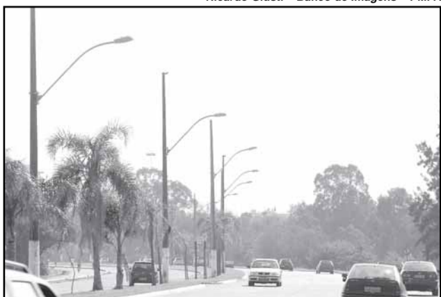
Duplicação da Avenida Edvaldo Pereira Paiva é uma das obras previstas