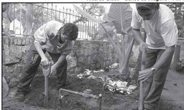
O Água Certa atende solicitações de serviços como instalação e troca de hidrômetros