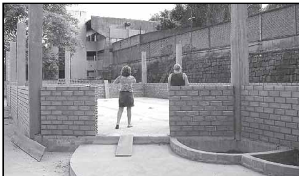
Obra deve ser inaugurada até o final de março