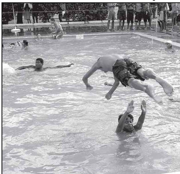
Participam representantes de sete Centros Comunitários, em oito categorias