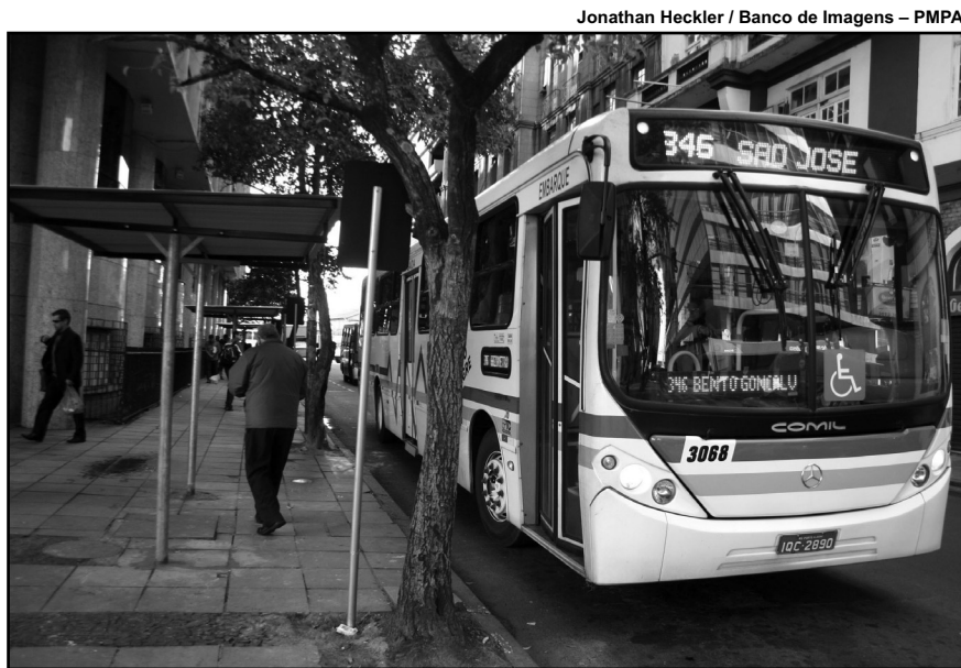
Usuário com transmissor poderá saber se o ônibus desejado está próximo