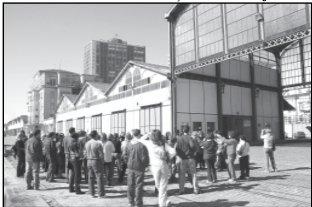
Neste ano, mais de 800 pessoas participaram das caminhadas do Viva o Centro a Pé

Em alguns pontos do centro, a reapropriação do espaço público já é uma realidade, como na área de abrangência dos projetos Viva o Centro a Pé e Caminho dos Antiquários. Segundo o coordenador de antiquários, as vendas nos sábados aumentaram e surgiram negócios com clientes de outros estados. Neste ano, mais de 800 pessoas participaram das caminhadas do Viva o Centro a Pé, que ocorrem no último sábado do mês.