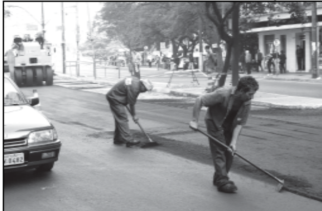
Das 37 vias, 24 já foram recuperadas, totalizando 790 metros de pista e 1,6 mil toneladas de asfalto