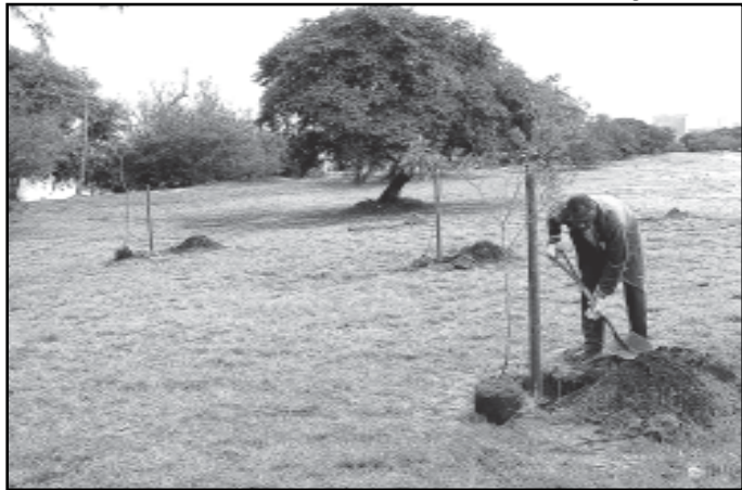
O novo Plano Diretor traz os métodos de preservação, manejo e expansão das árvores na cidade