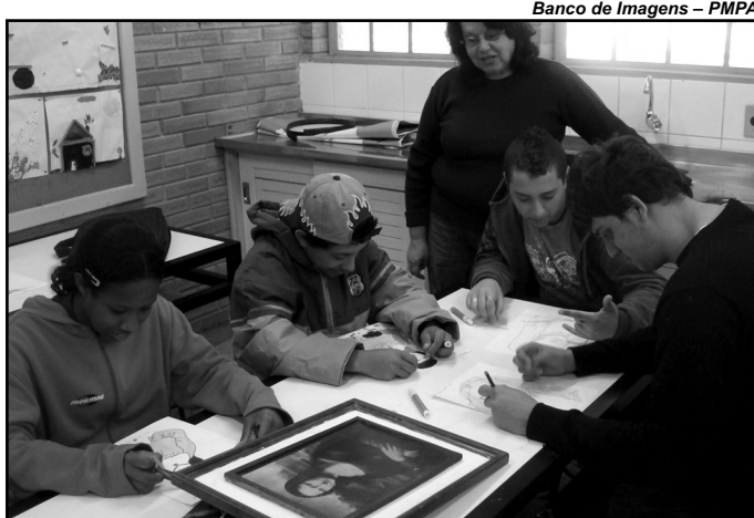
Estudantes desenvolvem trabalhos de projeto premiado

Criado pelo Ministério da Educação, por meio da Secretaria de Educação Especial com a Organização dos Estados Ibero-Americanos para a Educação, a Ciência e a Cultura, apoio do Conselho Nacional de Secretários de Educação e da União