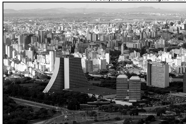
Identificação, delimitação e detalhamento das Áreas de Interesse Cultural e de Ambiência Cultural serão definidas por projeto de lei