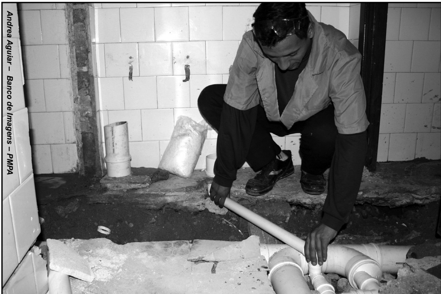
Entre os serviços previstos está o reparo de vazamentos hidráulicos

pinturas internas e externas, eliminação de infiltrações e instalação de equipamentos, entre outros tipos de reparos. A equipe é responsável pela manutenção predial (preventiva e corretiva) de mais de 130 prédios da SMS, que atenderá pedidos pendentes desde janeiro de 2009.