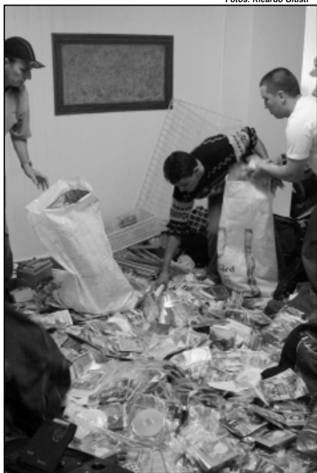
Depósito continha milhares de produtos falsificados...