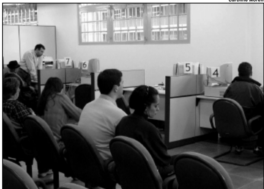
A nova loja conta com um moderno sistema de distribuição de senhas que reduzem o tempo de espera

Todos os órgãos das administrações direta e indireta do Município estão convidadas para este encontro esportivo e para organização do certame e garantia de maior número de servidores, está sendo agendada a primeira reunião com o presidentes das associações esportivas, para o dia 1º de junho, quarta-feira, às 19 horas, na Rua Érico Veríssimo, 843.