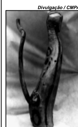
Exposição ficará até o dia 10

Exposições de arte ecológica, fotografias e maquetes e doação de mudas produzidas por jovens em situação de