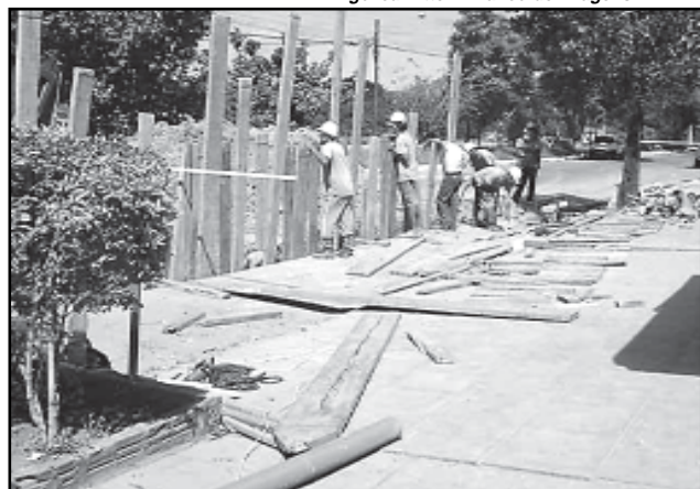
Bairro Restinga terá 80 quilômetros de redes de esgoto beneficiando 60 mil pessoas