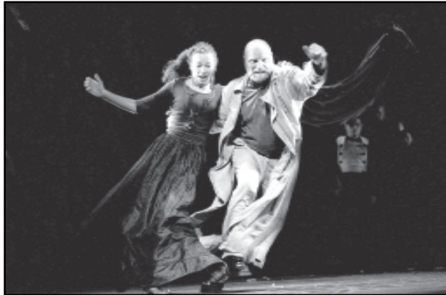
As apresentações de Hamlet (1997) e Othelo, (2006) foram marcantes na história dos palcos gaúchos