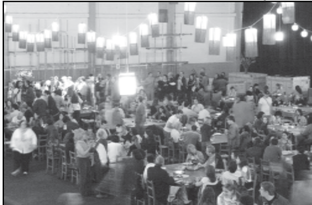
Théâtre du Soleil foi uma das atrações do 14º Porto Alegre Em Cena