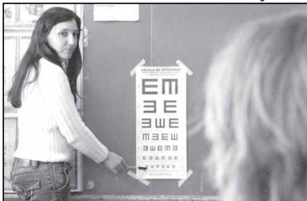
Equipe do Nasca examina alunos da Escola Neuza Goulart Brizola