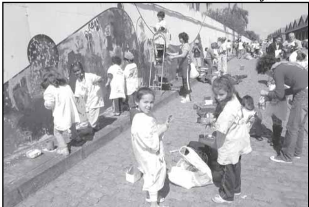
Pintura do Muro da Mauá por alunos é parte da programação do evento