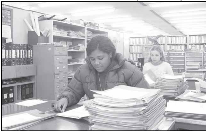
O setor abre em média 300 protocolos por dia