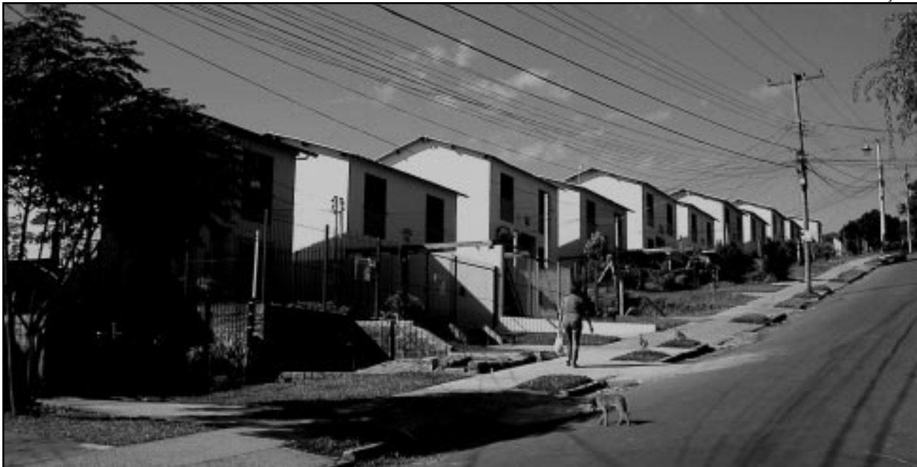
Loteamento São Guilherme recebe moradores de vilas localizadas em áreas de risco