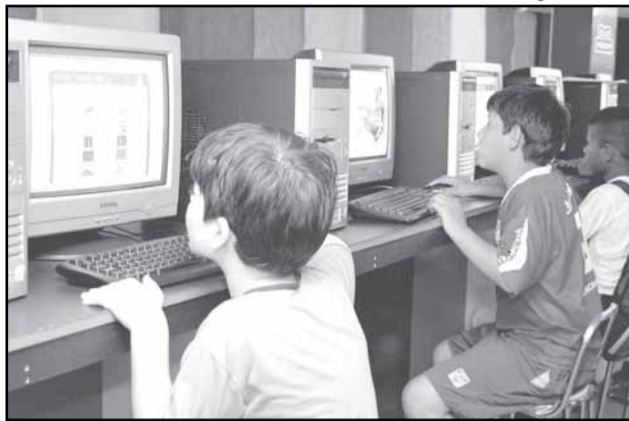
Vinte e uma escolas de educação infantil têm espaços informatizados