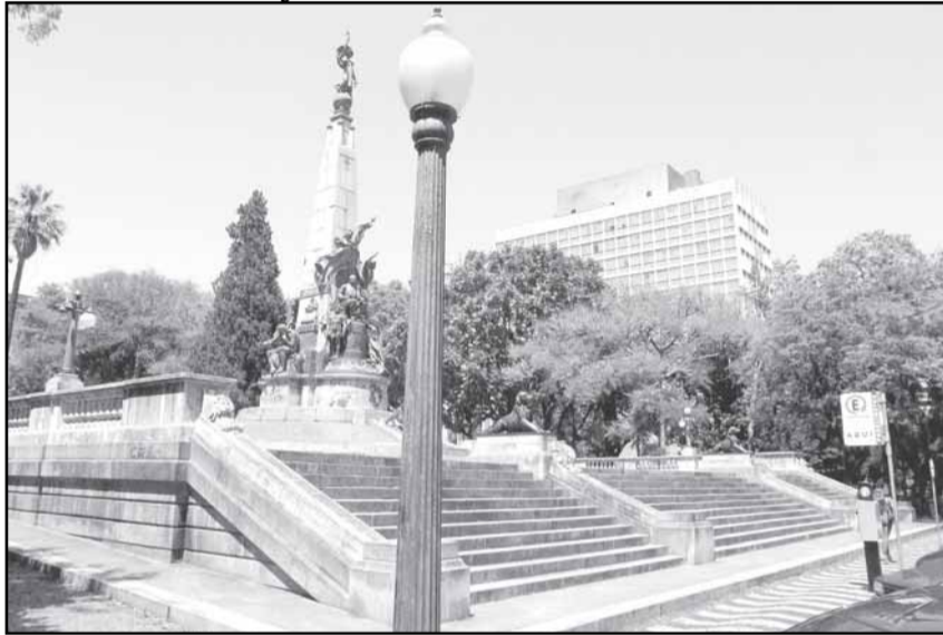
Praça da Matriz será revitalizada