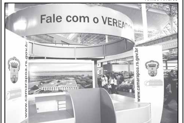
Consultas podem ser feitas no Mercado Público

Textos elaborados e de responsabilidade da Assessoria de Comunicação da Câmara