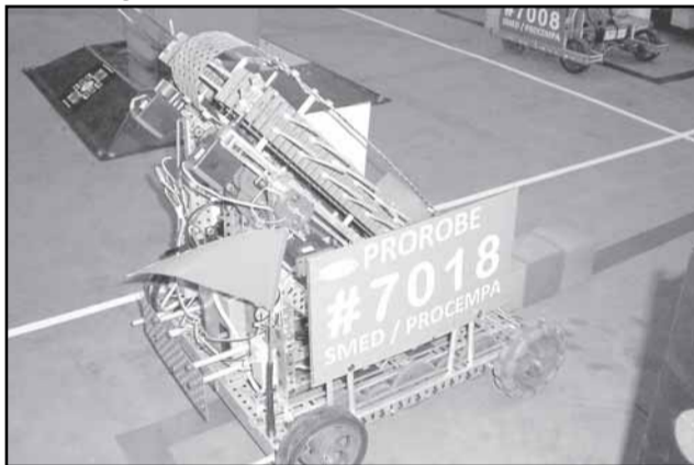
Prefeitura investiu R$ 2 milhões no projeto de robótica nas escolas

Com montante de R$ 2 milhões em investimentos, prêmios nacionais e internacionais conquistados e mais de 5 mil alunos atendidos, a robótica na rede pública municipal de ensino fechou o ano letivo de 2008 com saldo positivo. Há pelo menos uma equipe de robótica em cada uma das 45 escolas de ensino fundamental e nas escolas de Ensino Médio Emílio Meyer e de Educação Básica Doutor Liberato Salzano Vieira da Cunha.