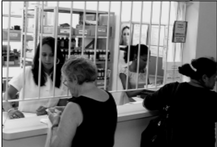
Lista municipal não era alterada desde 1997