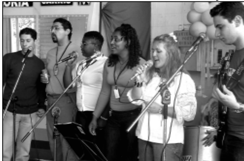
Oficina começou a funcionar em outubro do ano passado