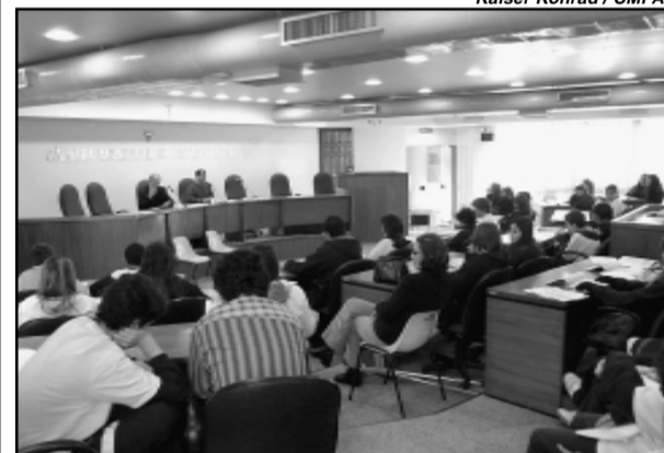
Alunos atuam como vereadores