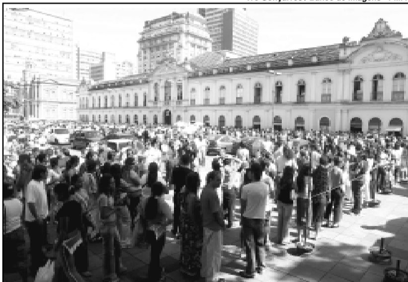
Cursos de capacitação da Smic têm grande procura

O encaminhamento dos trabalhadores ao benefício de seguro desemprego e a emissão da Carteira de Trabalho também poderão ser de responsabilidade da secretaria. O secretário municipal da Produção, Indústria e Comércio está negociando com a Delegacia Regional do Trabalho (DRT) e a Fundação Gaúcha do Trabalho e Ação Social (FGTAS). O objeti-