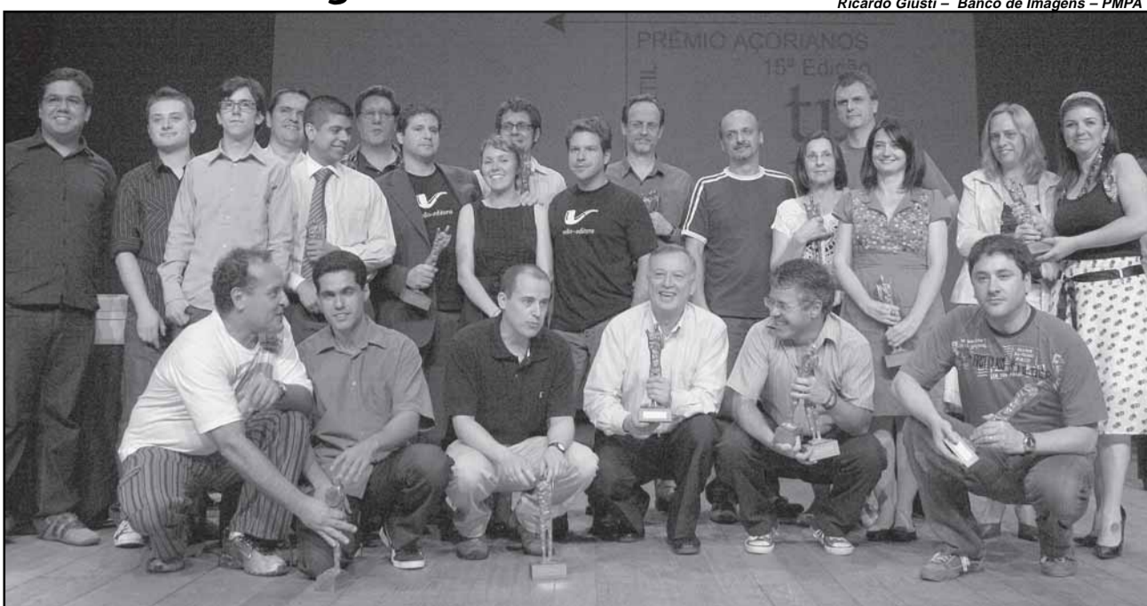
A tradicional Noite do Livro (foto), dia 14 de dezembro, vai homenagear os finalistas e os leitores das maratonas literárias

Em paralelo ao prêmio, e como forma de divulgá-lo, será realizado o seminário Debates Contemporâneos, no Instituto Goethe e no Instituto de Letras da UFRGS, dias 24, 25 e 26 de novembro. O seminário propõe uma pausa para o debate sobre literatura contemporânea e incentivo à leitura. A programação é gratuita.