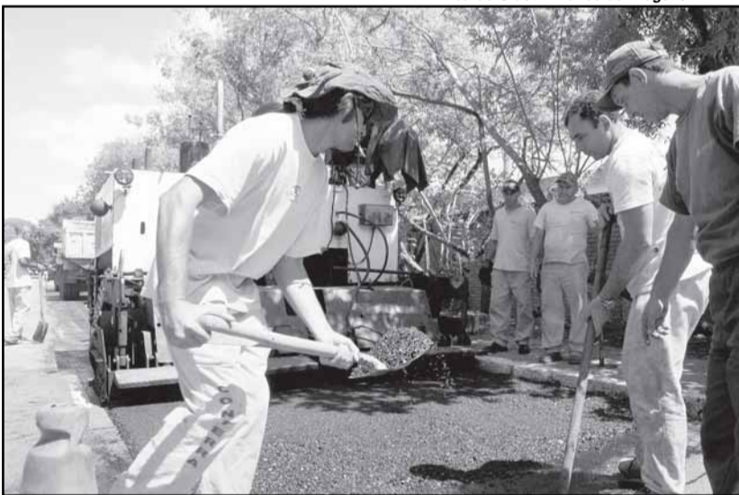
Prefeitura já aplicou 51 mil toneladas de asfalto nas vias da cidade, com investimento de R$ 15 milhões