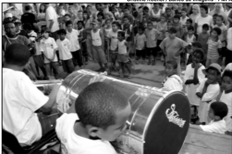
Durante a inauguração, crianças fizeram atividades culturais, esportivas e de recreação

CONCURSO FOTOGRÁFICO - Disponível até 1º de dezembro o regulamento do concurso fotográfico Porto Alegre Quatro Estações. O documento pode ser retirado na sede da Smam (Av. Carlos Gomes, 2120) ou acessado no site www.portoalegre.rs.gov.br/smam . Informações: 3289-7524. Inscrições em maio de 2007.