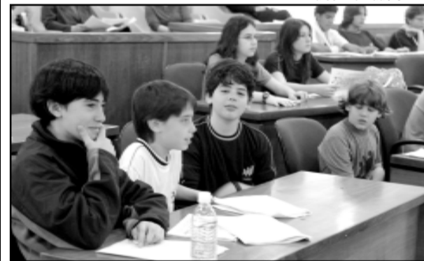
Alunos criticaram corrupção no país