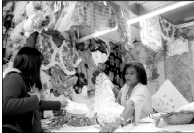
16ª edição da feira recebeu 135 mil visitantes