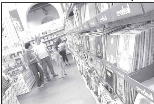
Público visitante na feira ultrapassou 54 mil pessoas