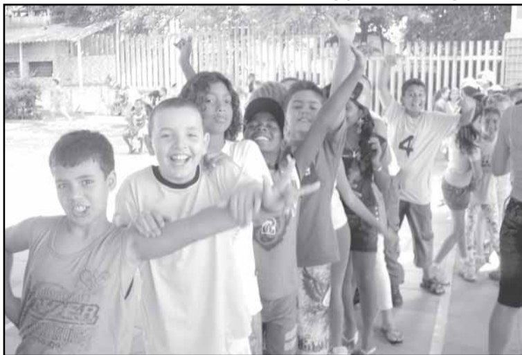
Escola Jean Piaget recebe alunos com atividades recreativas

Já estão matriculados nas escolas municipais 55 mil alunos, mas quem não está em sala de aula deve procurar a escola em que gostaria de estudar e verificar a possibilidade de vaga. Caso a escola não tenha espaço, a alternativa é tentar a Central de Matrículas, pelo fone 3288 4888.