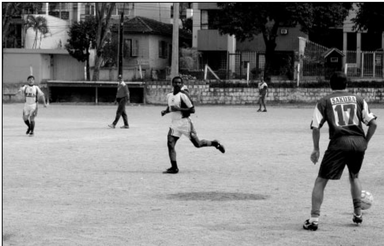
Equipes que vão entrar na competição fazem um torneio-início dia 28