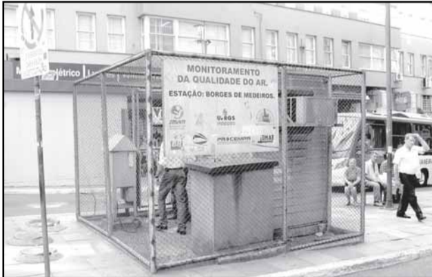
Nova medição foi realizada na sexta-feira, 1º de maio