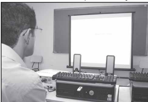
A formação prepara alunos para o mercado de trabalho no segmento da Tecnologia da Informação