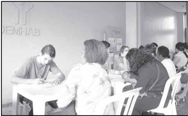
A prefeitura disponibiliza vários locais para o cadastramento