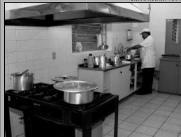
Trabalham na Nova Vida auxiliares de enfermagem, psicólogos, enfermeiras, terapeuta ocupacional e nutricionista