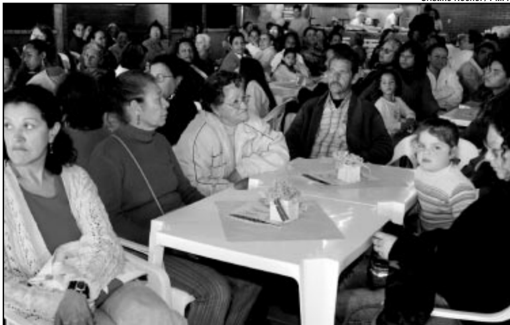
Alunos, a maioria com mais de 50 anos, fizeram relatos sobre a emoção de aprender a ler e escrever