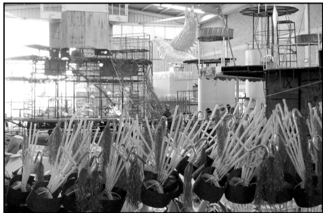
Cerca de 1,5 mil integrantes prometem agitar os foliões no domingo