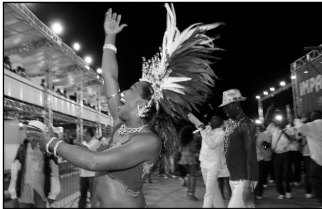
O desfile das escolas do Grupo Especial começa hoje às 23h15