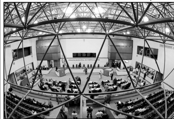
Plenário da CMPA

A Comissão de Urbanização, Transportes e Habitação (Cuthab) da Câmara Municipal de Porto Alegre aprovou o veto parcial do Executivo municipal ao projeto de Lei Complementar da Arena do Grêmio Foot-Ball Porto Alegrense. Conforme o veto do Executivo, a redação do artigo 9 da proposta apresentada “inova em matéria que não possui relação com o projeto desenvolvido para a construção da Arena”.