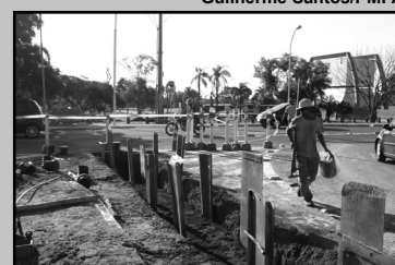
Duplicação da Beira-Rio é uma das ações a serem detalhadas

Iniciativas da prefeitura para a realização da Copa do Mundo em Porto Alegre serão destacadas hoje, 1º, pelo secretário extraordinário da Copa de 2014, em palestra na