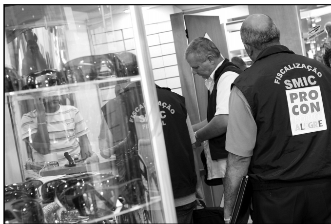
Procon alerta: É direito do consumidor ter o preço exposto na vitrine

Outro cuidado importante deve ser observado na hora de pagar as compras de Natal. As lojas não podem fazer distinção entre o pagamento à vista e o realizado em cartão de débito ou crédito em uma só parcela. “Preço à vista é somente um”, destaca Ferri Júnior. “Quando oferecido um desconto à vista, o mesmo abatimento prevalecerá para os pagamentos com cartão de débito ou de crédito, desde que a dívida seja liquidada em uma só vez”, acrescenta.