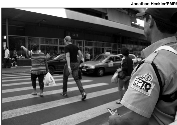
Fiscalização junto às faixas é uma das medidas

A programação da XV Cúpula da Rede Mercocidades e da 58ª Reunião Geral da FNP segue até a sexta-feira, 3. A realização conjunta dos eventos buscará discutir de forma mais ampla e abrangente o tema “Desafios e perspectiva para o desenvolvimento local e integração regional”.