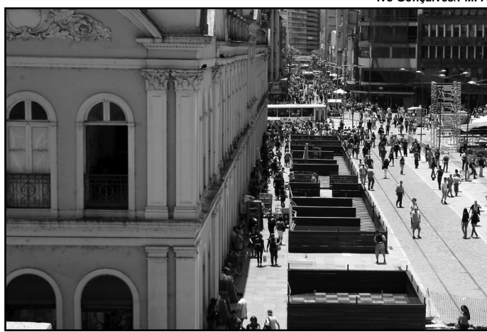
Melhorias no Largo Glênio Peres promovidas pela Coca-Cola

Serviço qualificado - Também estão sendo qualificados os serviços de bares e restaurantes do mercado, com o treinamento dos profissionais, aliando a parceria do Sebrae e Sindipoa. A medida visa à preparação da cidade para a Copa do Mundo de 2014, e os treinamentos são realizados nas áreas de gestão de pessoas, excelência no atendimento de garçons, atendimento ao cliente e segurança alimentar.