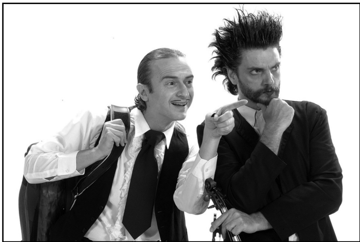
Vencedores serão conhecidos segunda-feira, 13, no Renascença

Na noite de premiação, serão conhecidos os vencedores nas categorias capa, projeto gráfico, infantil, infanto-juvenil, conto, crônica, poesia, narrativa longa, ensaio de literatura e humanidades, especial e a coletânea inédita do Prêmio Açorianos de Criação Literária. Os vencedores dessas categorias serão anunciados ao ritmo do Copérnico. Também serão premiados dez livros e dois destaques literários.