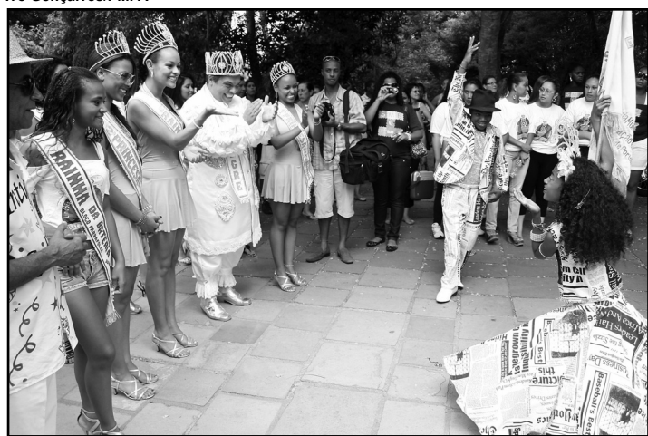
No ano passado, a promoção foi realizada no Parcão

tribuirão materiais de divulgação do calendário dos bailes de salão do programa Estação Folia 2011 e do Baile Dá Saudade, uma novidade dirigida ao público da terceira idade.