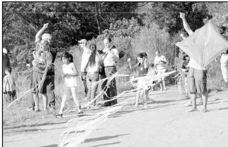
Oficinas ensinarão a confeccionar as pipas, que serão levantadas do morro

Em comemoração aos 15 anos do Parque Natural Morro do Osso, a Secretaria Municipal do Meio Ambiente (Smam)