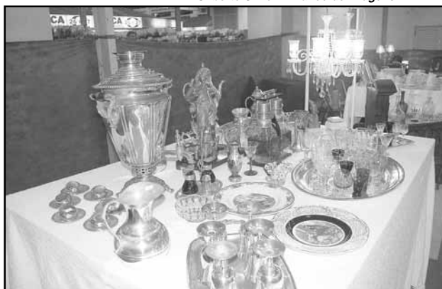
A feira conta com a participação dos expositores de antiguidades do Brique da Redenção

A 1ª Feira de Antiquidades é uma ótima opção de programa para os frequentadores do Mercado Público e do Centro Histórico. O evento conta com a participação dos expositores de antiguidades do Brique da Redenção. Uma nova edição da Feira no Mercado Público será realizada de 13 a 17 de outubro com a participação de aproximadamente 30 expositores.